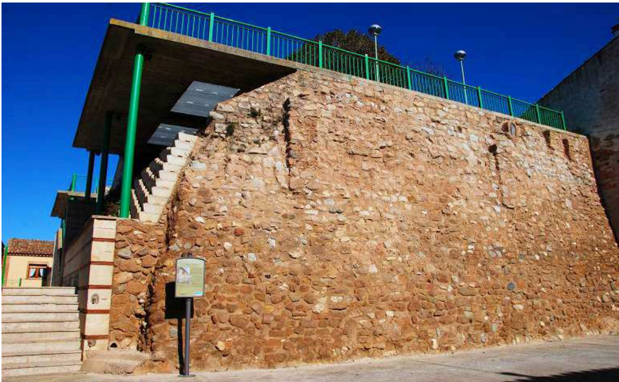
Revestimiento de piedra sobre la roca en donde se asentaba la fortaleza