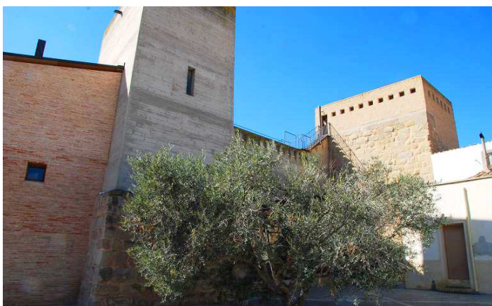
Vista de los torreones de la fortaleza