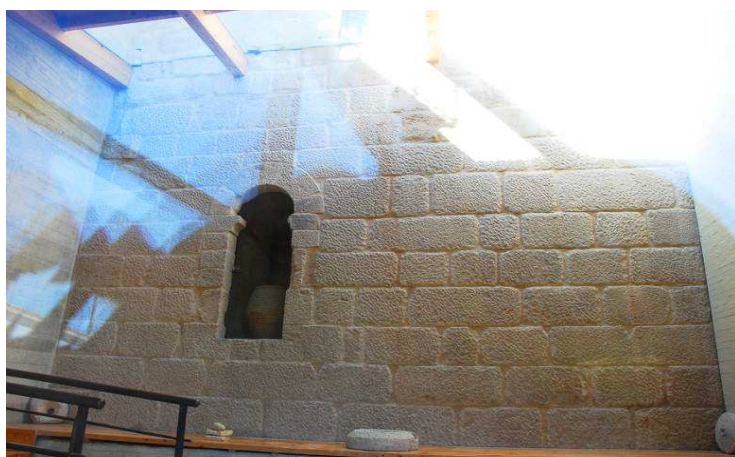
Vista del muro que subsiste de la torre mayor, con puerta en altura