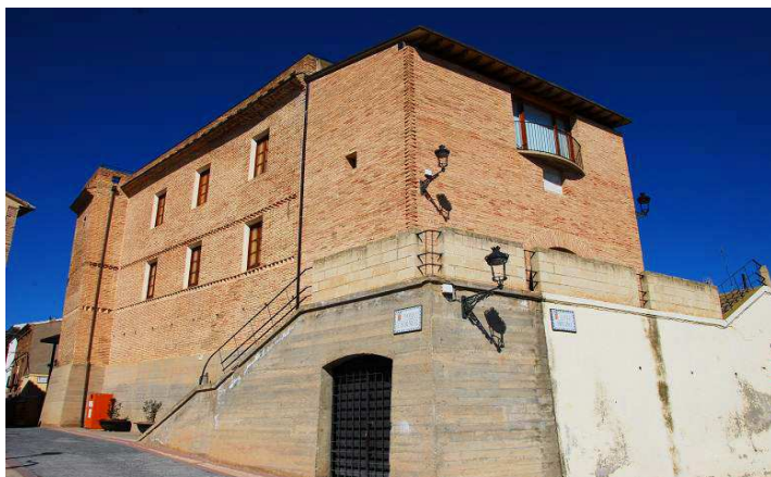
Parte posterior de aspecto palaciego