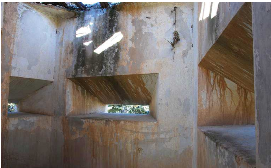
Detalle del interior de la casamata de flanqueo con sus aspilleras