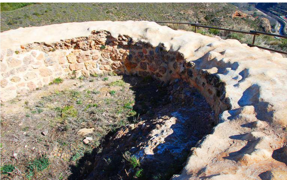
Grosor del muro e interior de la torre