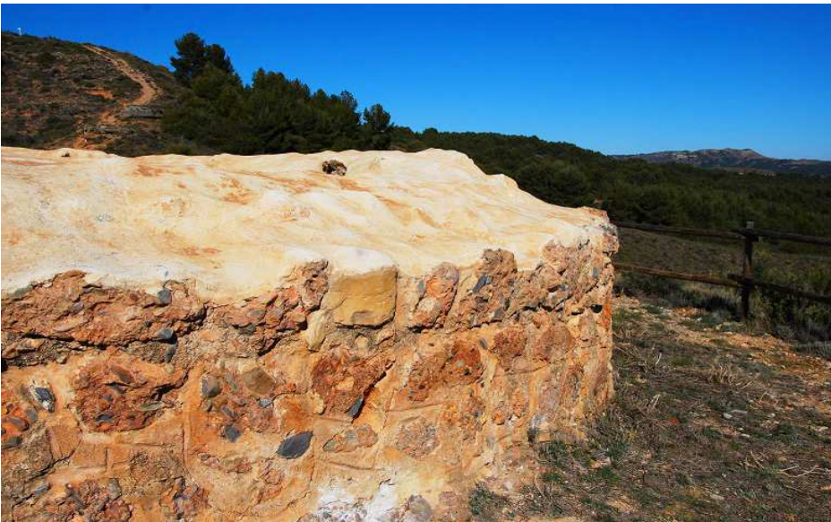
Exterior del muro de la torre