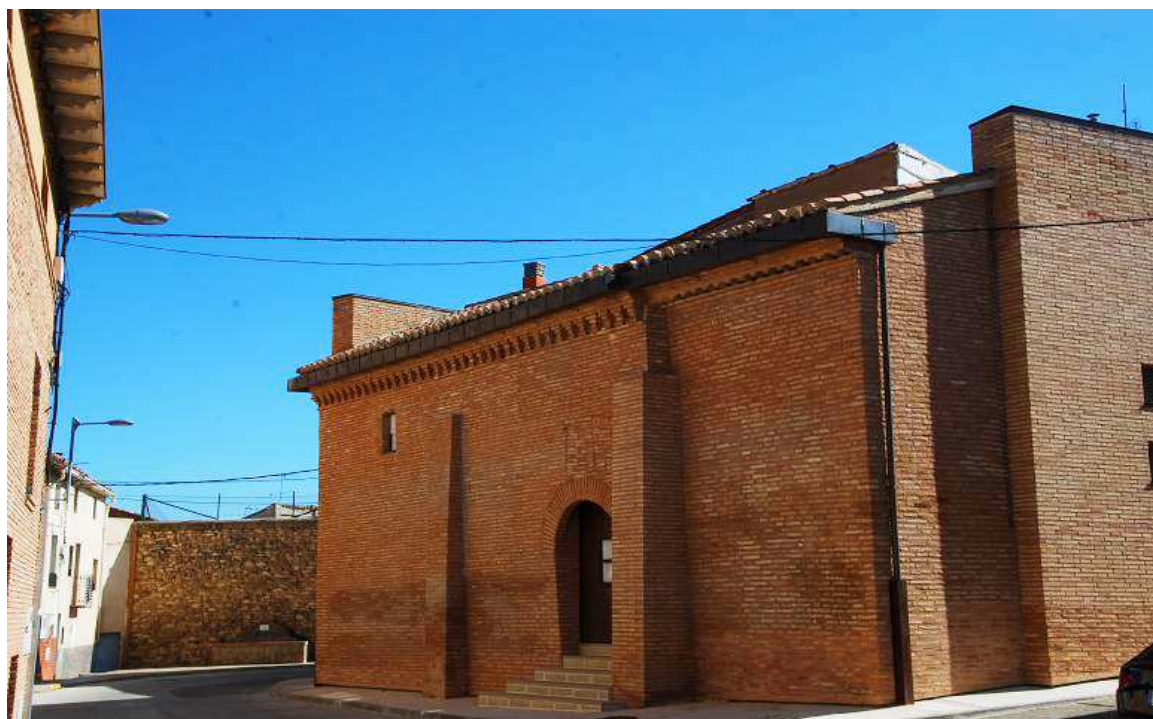
Exterior de la mezquita en la que estan ocultos los restos de la torre