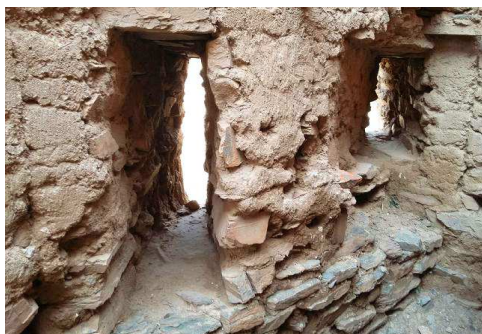
aspilleras en la torre más al exterior