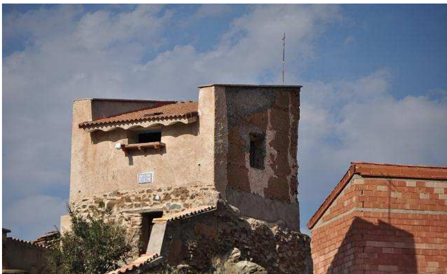
Detalle de la torre E