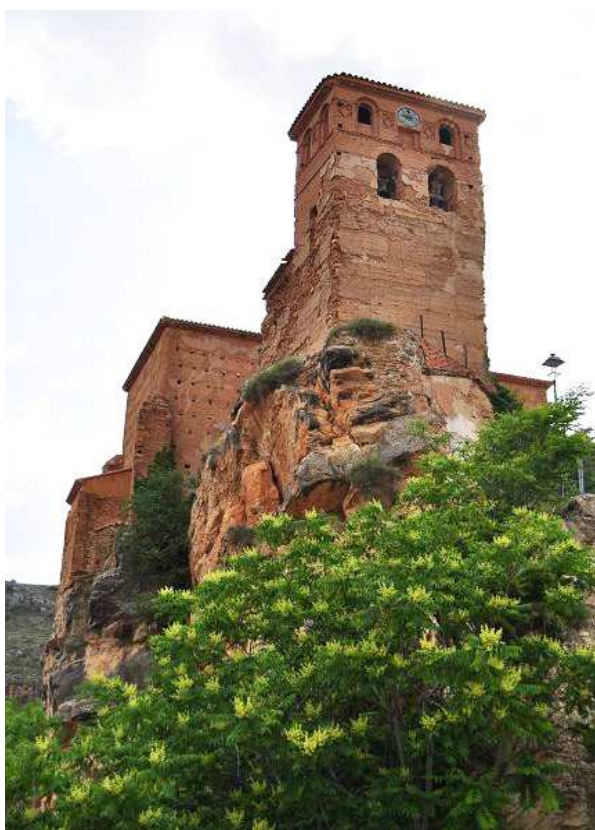
Restos del castillo integrados en la iglesia