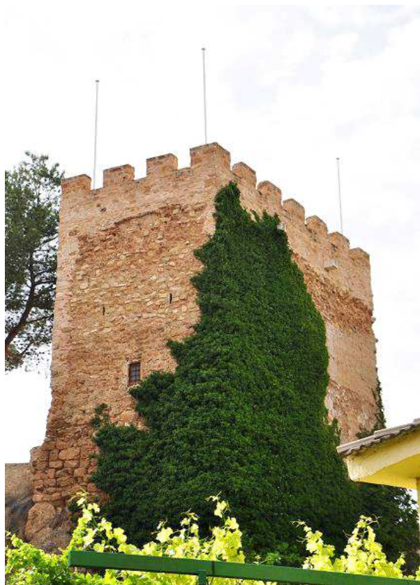
Torre de Homenaje desde la carretera