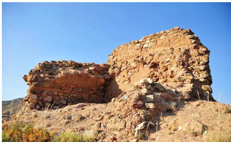
Vista interior de una de las torres