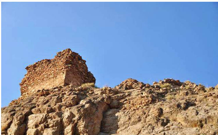
Vista exterior de una de las torres