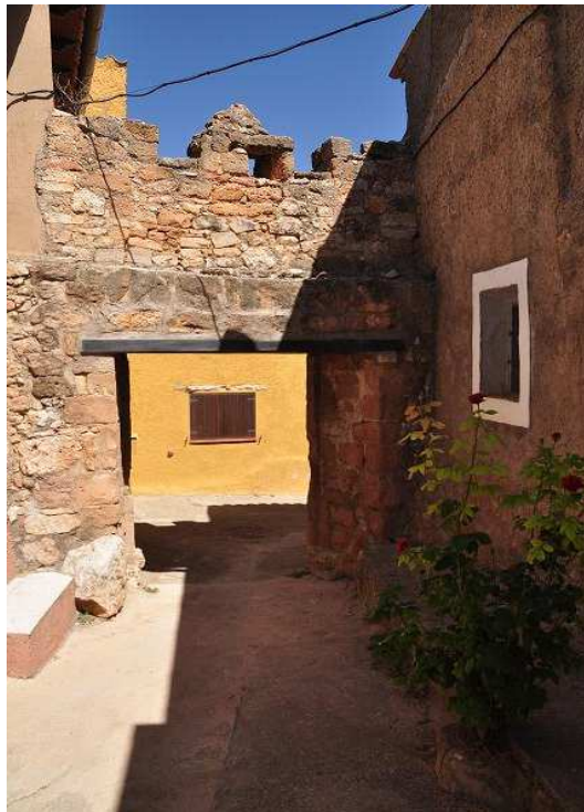
Vista de la puerta desde intramuros