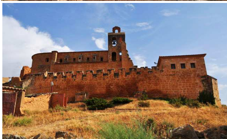
Muralla almenada del primer recinto. A modo de barbacana delante de la iglesia.