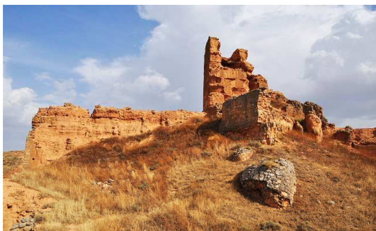
Interior del castillo con la arruinada torre principal.