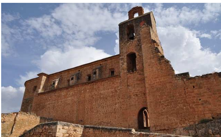
Vista del acceso por debajo de la torre de la iglesia, la cual está amatacanada.