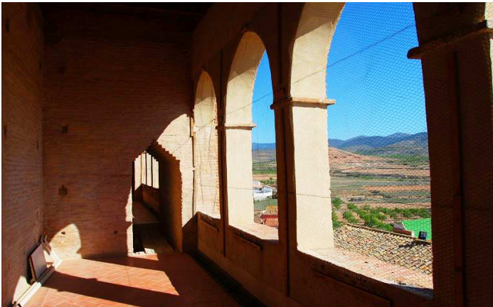
Andito con claros fines defensivos