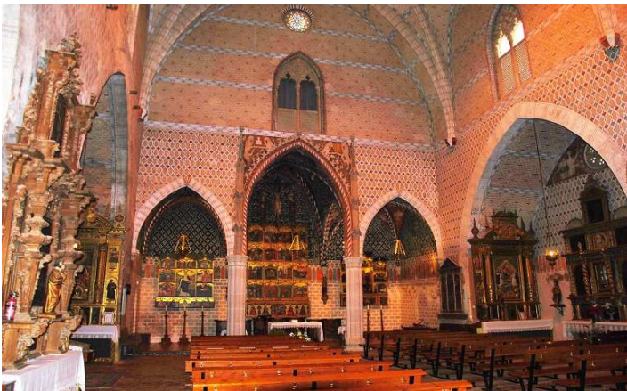
Interior del templo parroquial