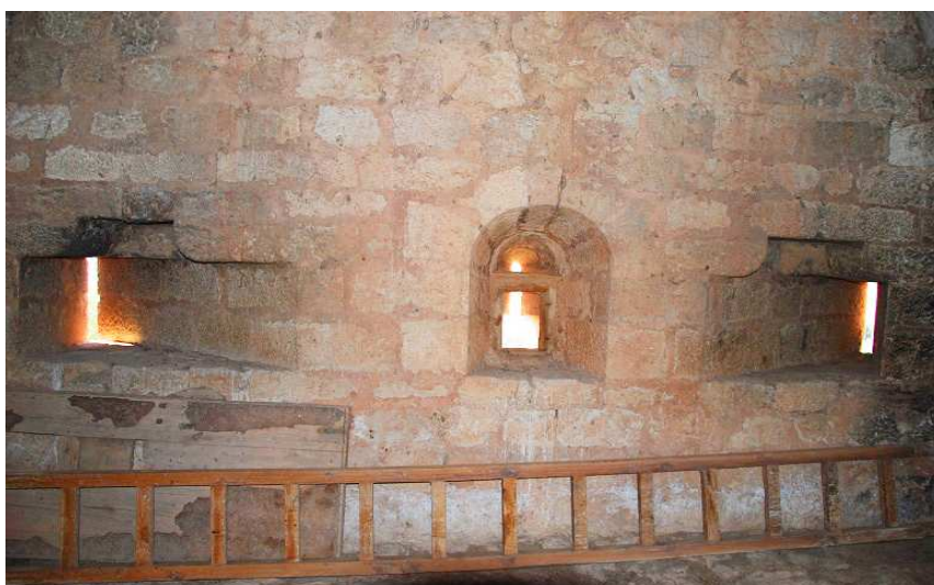
Aspilleras desde el interior de la torre