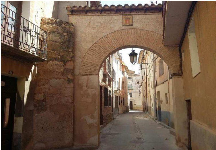
Arco ubicado en la calle Poniente Puerta de la Villa