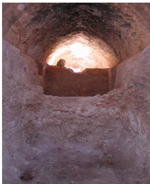
Restos adosados al cerro e interior del aljibe