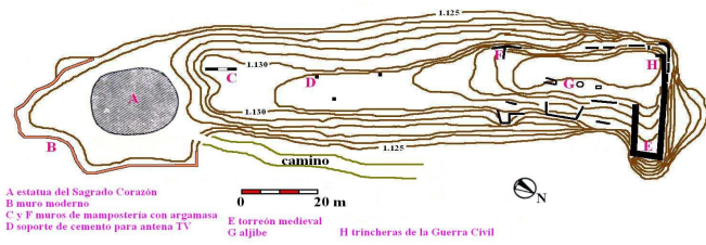
Estructuras visibles en la cima del cerro del castillo de Alfambra