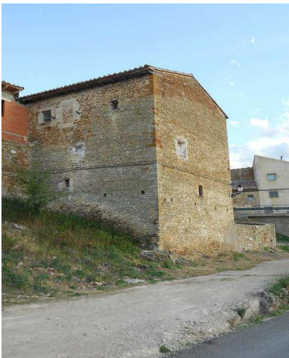
Parte posterior de la casa, en su planta baja abre un vano aspillero.