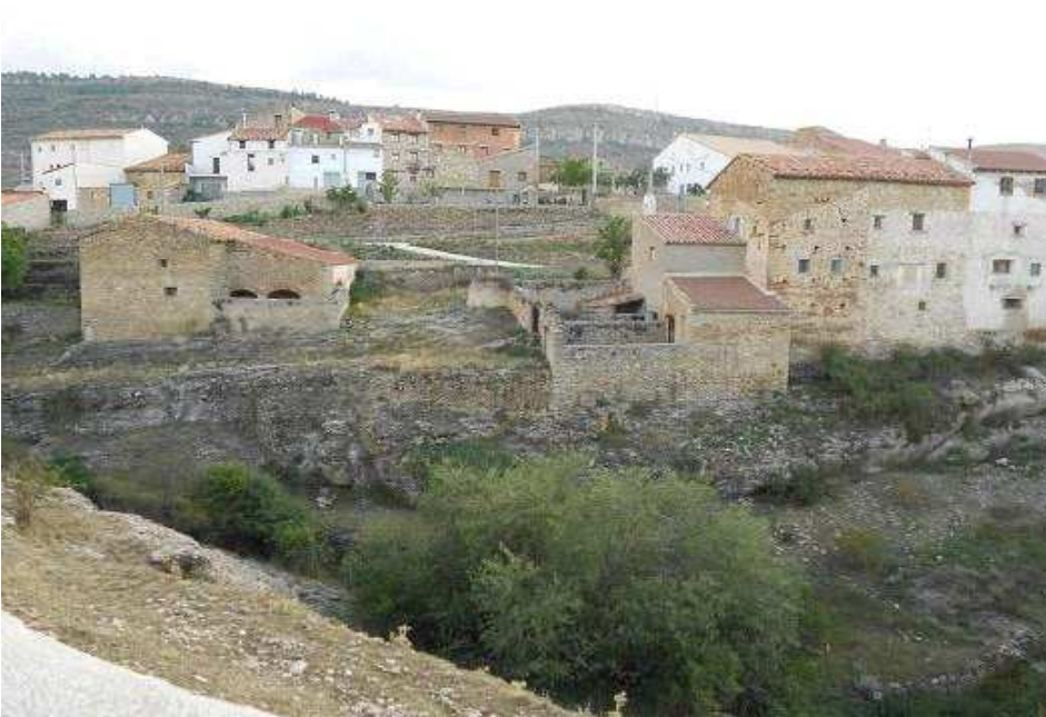
Vista general de la calle Magdalena, en donde está la vivienda