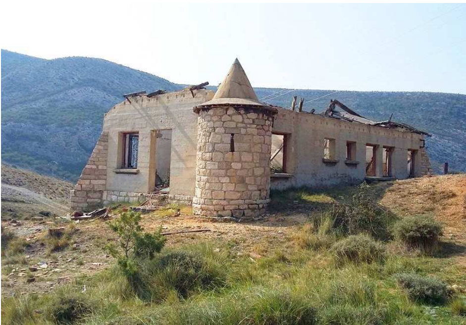
El lado exterior que mira al monte.