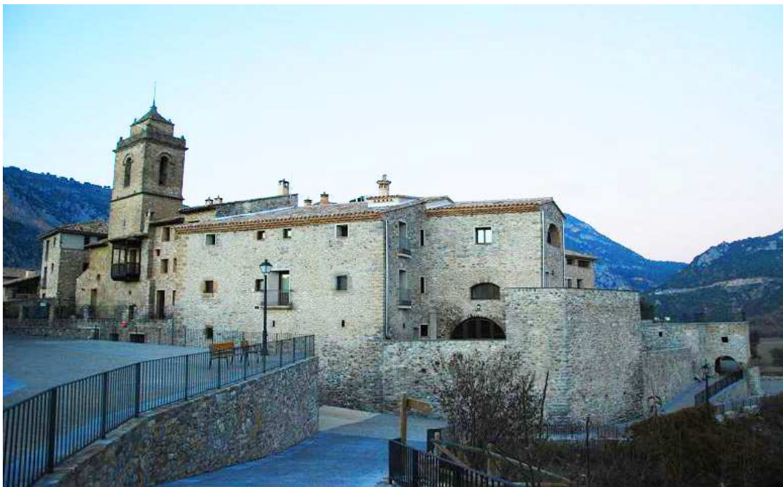
Vista general del frente del pueblo con la iglesia