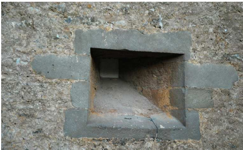
Detalle de la tronera abierta en la torre