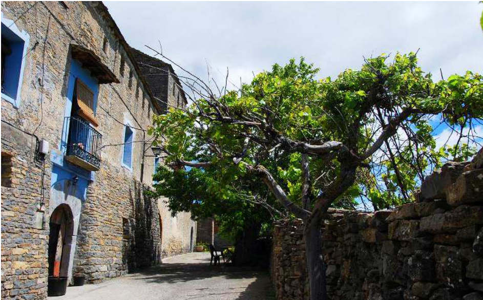
Vista de la calle donde se alza la vivienda y torre