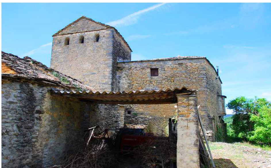
Vista posterior del conjunto