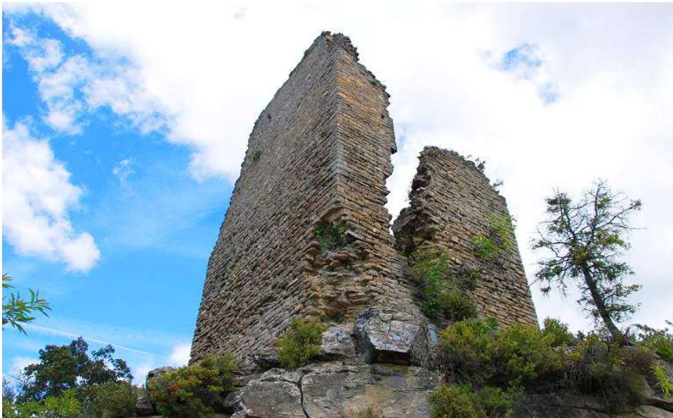
Vista por debajo de la plataforma donde se asienta la torre