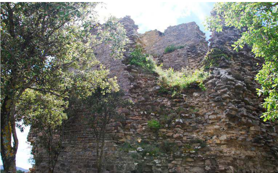
Vista de la parte que da al N