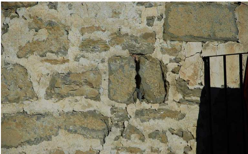
Detalle de aspilleras defensivas