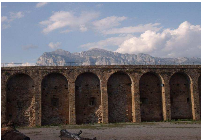
Arcadas del s. XIX