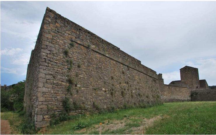
Detalle del foso y baluarte este