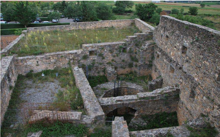
Interior del baluarte este en cuyo interior se encuentra el cubo artillero