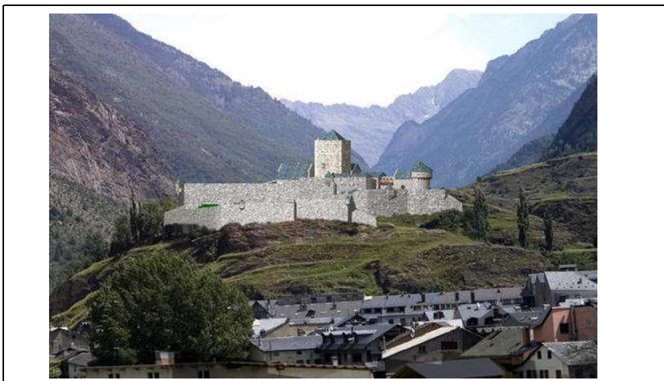
© Aspecto que pudo tener el castillo sobre Benasque (Alberto Vazquez Yarza)

Hoy en día escasos restos abovedados y de muros subsisten en el lugar donde antaño se levantó un magnífico castillo.