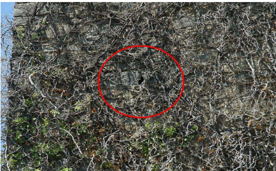
Detalle de una aspillera abierta en el muro de la torre.