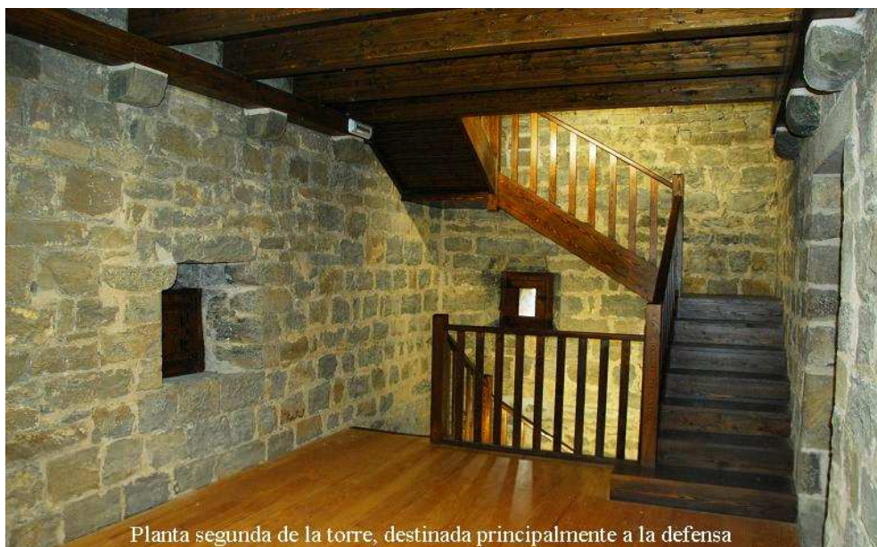
Planta segunda de la torre, destinada principalmente a la defensa