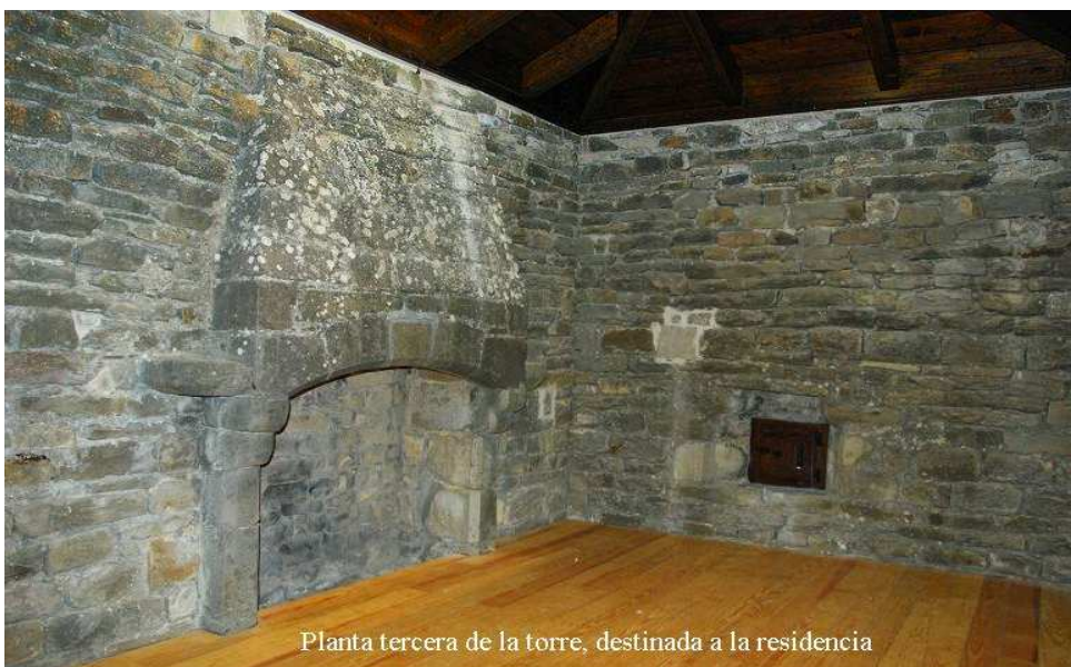
Planta tercera de la torre, destinada a la residencia