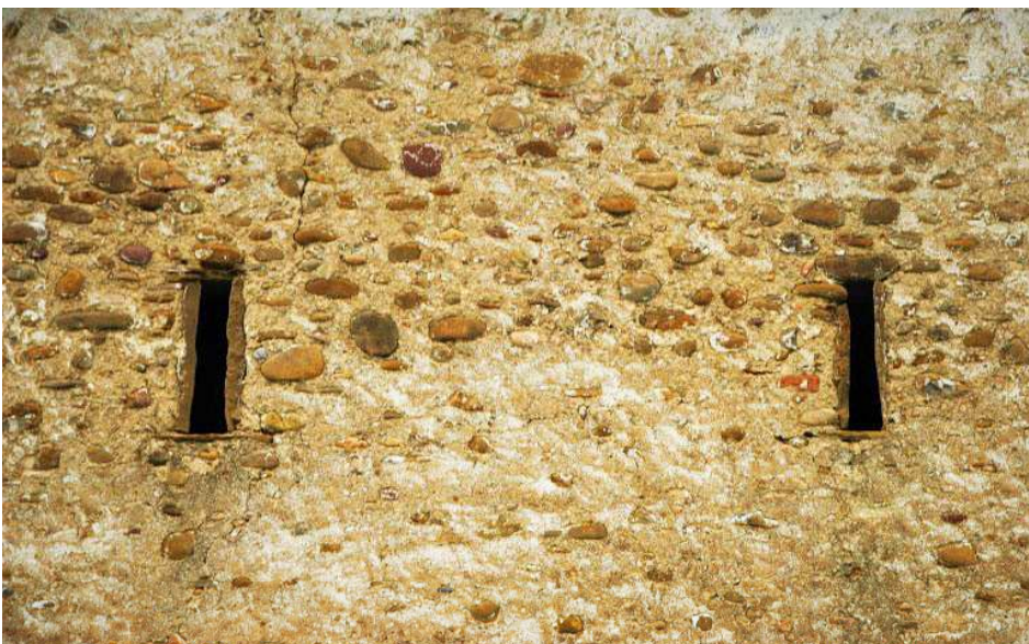
Detalle de aspilleras muro S exterior