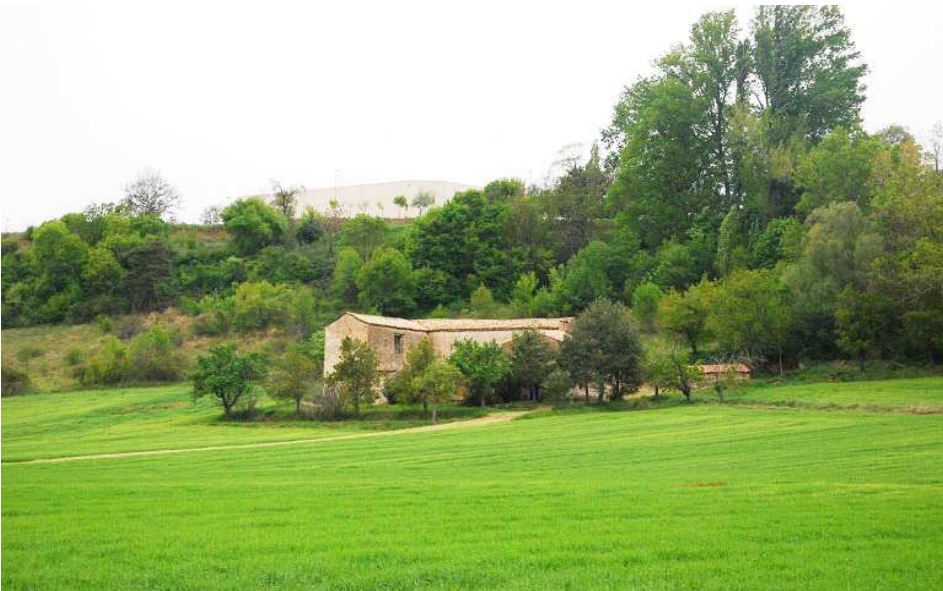
el edificio desde el camino